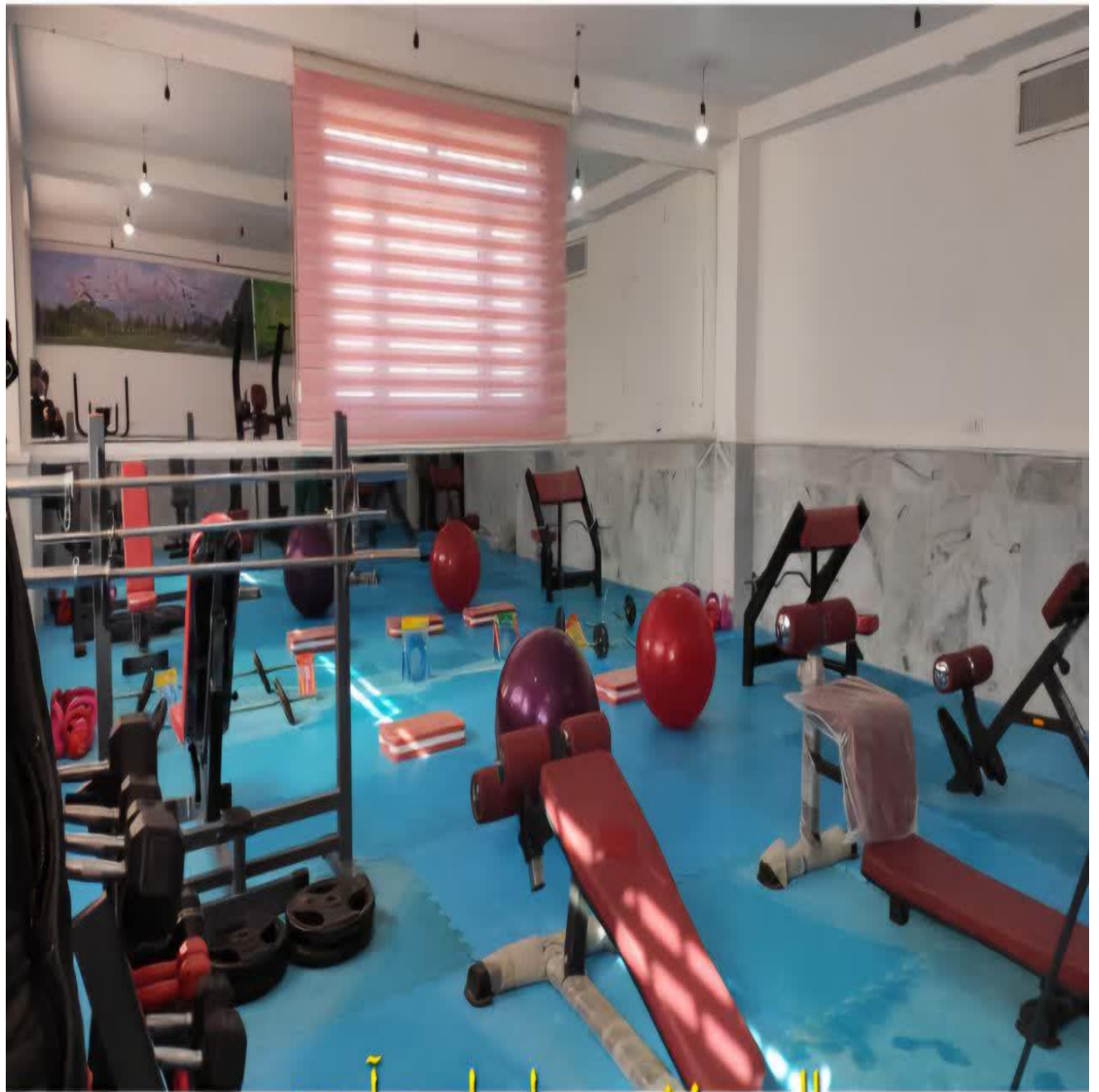
سالن ورزشی سرای امید آینده