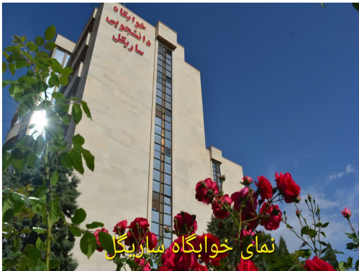
نمای خوابگاه ساریگل