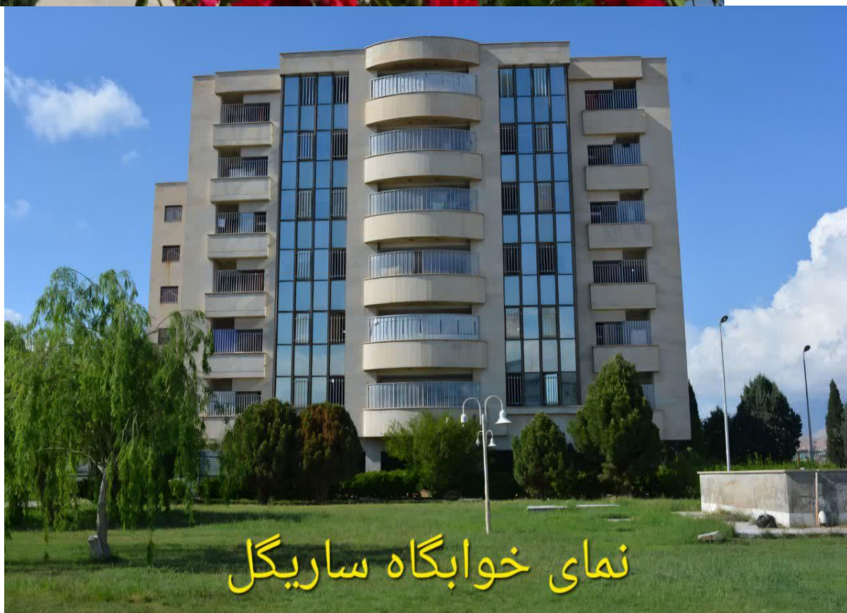
نمای خوابگاه ساریگل