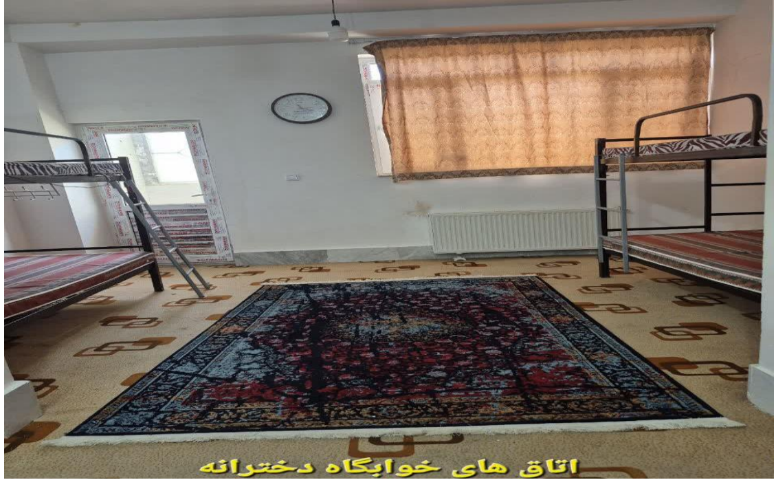
اتاق های خوابگاه دخترانه