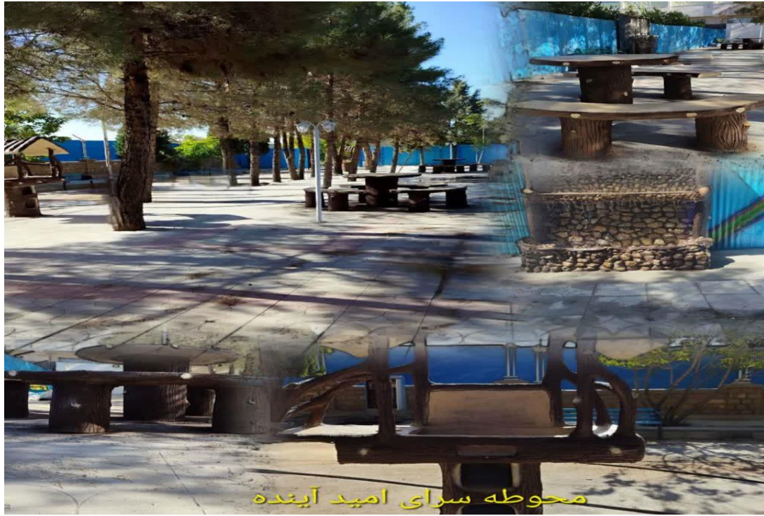
محوطه سرای امید آینده